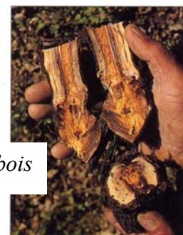
Dégâts d'Esca sur bois