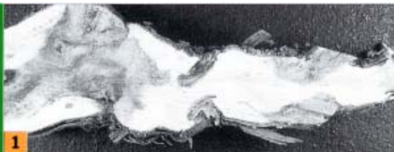
Photo 1 : dans la taille Guyot, les plaies sont opposées et la sève circule mal du fait de la position des cônes de bois sec. Photos 2 et 3 : dans la taille Guyot-Poussard, les plaies sont toutes du même côté (partie supérieure des bras) et la circulation de la sève bien meilleure.