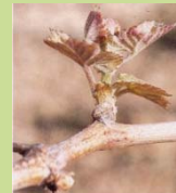
09 - 2 ou 3 feuilles étalées