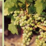
35 - Début véraison