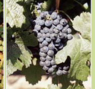
37 - Fin véraison