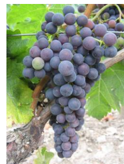
M37 Fin véraison (BBCH 87)