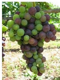
M36-Mi-véraison (BBCH 85)