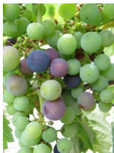
M35-Début véraison (BBCH 82)