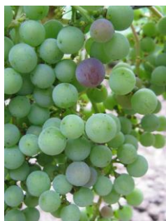
L34-1 ères baies vérées (BBCH 81)

Toutefois, sur des parcelles précoces, le stade de fin véraison est déjà observé.