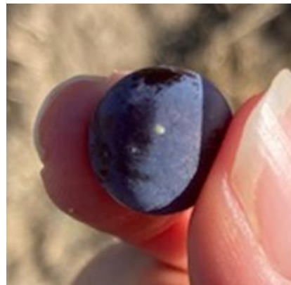
Ponte sur baies

pour 50 grappes (source CA33 et CA24). Toutefois, il a été signalé, aujourd'hui localement jusqu'à 100 % de pontes avec parfois 6 pontes sur la même grappe sur une parcelle située en Dordogne (source CA24).