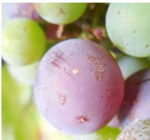
Ponte stade intermédiaire

L'observation des pontes et la détermination du stade des œufs (stade tête noire) sont des éléments importants pour optimiser le positionnement d'une éventuelle protection.