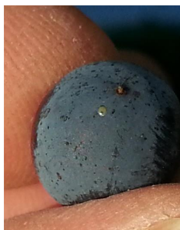
Ponte stade tête noire