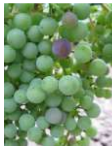
L34-1 ères baies vérées