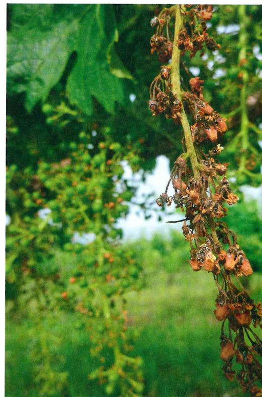
Grappe détruite par le mildiou. Les OAD peuvent aider à baisser le nombre de traitements, souvent en début de saison.

La plateforme internet AgroClim de la société Promété, modélise le comportement des maladies (mildiou, oïdium, black rot, botrytis) et ravageurs (eudémis et cochylis) sur une surface d'un kilomètre carré. En fonction de données météo, du cépage, du stade phénologique de la vigne, et de paramètres agronomiques impactant significativement le développement et la sévérité de la maladie, la plateforme prédéfinit une courbe de seuil de risque. “ Les données météo sont fournies, soit par une station météo réelle placée dans les rangs de vigne, soit par une station météo virtuelle, qui grâce aux données GPS de la parcelle, estime pluviométrie et température, en recou- pant les informations de plusieurs prévision-