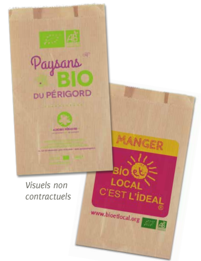
Visuels non contractuels