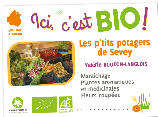
Exemple de banderole personnalisée Visuels non contractuels

Certains panneaux, commandés à l'occasion des premières commandes groupées, n'ont pas résisté aux UV et leurs couleurs sont passées avec le temps. Les nouveaux matériaux utilisés étant beaucoup plus résistants, AgroBio Périgord vous propose un tarif préférentiel pour vous permettre de remplacer ces supports pour 65€ HT (au lieu de 100€) pour un panneau personnalisé au format 120 x 80 cm (modèle ci-dessus). Pour en bénéficier, nous vous remercions de nous faire parvenir une photo du panneau abîmé à remplacer (un nouveau visuel vous sera proposé).